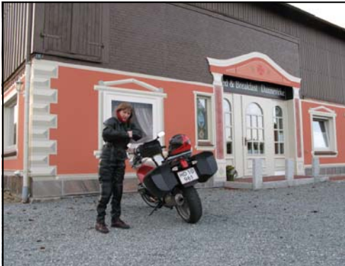
Min dejlige kæreste og min ny indkøbte BMW foran B&B Dannevirke i Owschlag. Dejligt morgenbord, snapsen kommer senere!