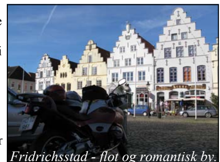
Fridrichsstad - flot og romantisk by.